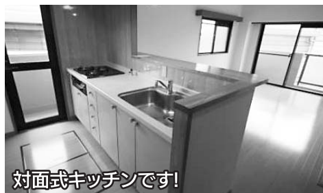
対面式キッチンです!