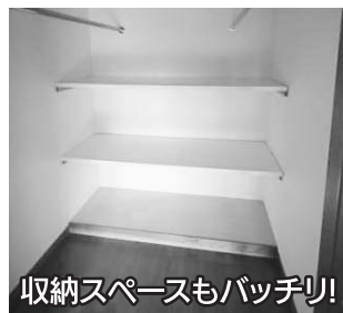
収納スペースもバッチリ!