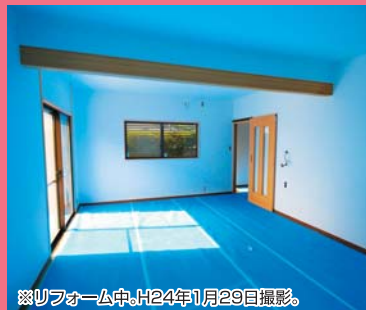
※リフォーム中。H24年1月29日撮影。