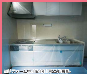
※リフォーム中。H24年1月29日撮影。