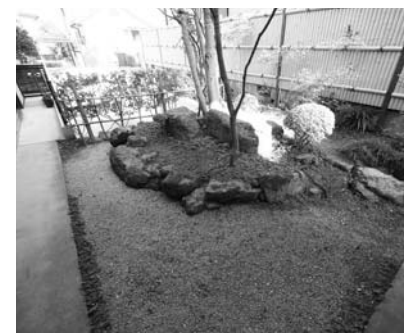
和モダンのくつろぎ庭。