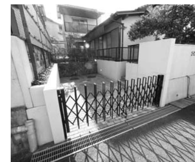
駐車場増設可能です。